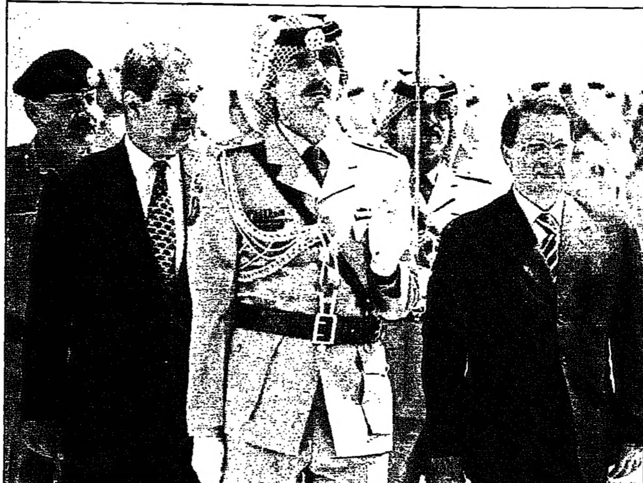
رئيس الوزراء الأردني فايز طراونة لدى استقباله نظيره التركي مسعود يلماظ في عمان أمس

عمان - القدس العربي: حلفي رئيس الوزراء التركي مسعود يلماظ واستقباله اخطاها وسياسي بارز في العاصمة الأردنية عمان الذي زارها اليوم واحد اسر قبل ان يكمل جولته في المنطقة، ويرافق يلماظ في جولته وفد تركي ضم يضم أكثر من 150 شخصا من بينهم مجموعة من رجال الأعمال وعدد كبير من الإعلاميين والمسؤولين العسكريين والامينين، كما تم تعزيز الحراسة الأمنية في الشوارع الرئيسية في العاصمة لحماية الضيف التركي ومرافقيه الذين تم توزيعهم على اربعة فنادق راقية.